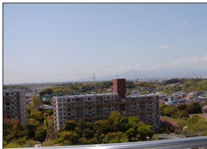
※南側バルコニーからの眺め。